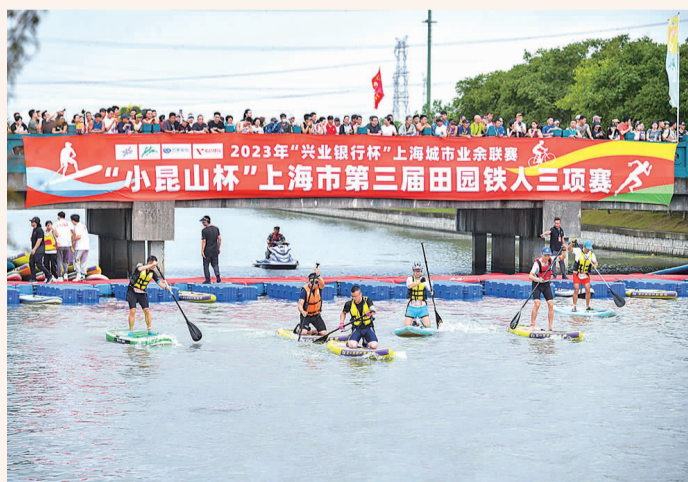
有“沪上最美铁人三项赛”之称的上海城市业余联赛“小昆山杯”上海市第三届田园铁人三项赛激情开赛。(上海松江)